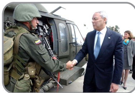
Visita de Colin Powell a Colombia en apoyo al Plan Colombia

Las FARC negocian con el presidente Andrés Pastrana la “zona de distensión” que abarca 42.000 kilómetros cuadrados de territorio colombiano.