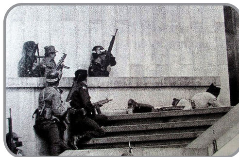
Soldados del Ejército esperan la entrada de los tanques Cascabel, para avanzar con su cobertura hacia el interior de las edificaciones tomadas por el M-19 pocas horas antes. Plaza de Bolívar (Bogota). 6 de noviembre de 1985. Hacia las 14:00 horas. Foto del archivo familiar Gomez Ospina.) Trabajo de Fedayin17