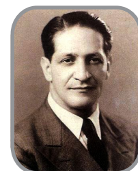
Jorge Eliécer Gaitán