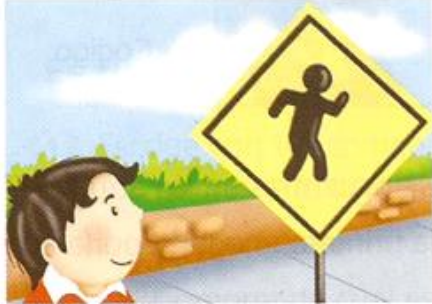
Código: Pictograma, imagen Canal: Visual

2. Observa en las siguientes imágenes la diferencia entre el código y el canal.