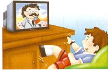
Código: Pictograma, imagen Canal: Visual

3. Observa las siguientes situaciones. Completa cuales son los elementos de la comunicación en cada caso.